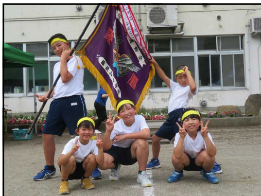
全員主役でがんばった子どもたち

15日(金)に実施した運動会ではご参加・ご協力いただきありがとうございました。皆様のおかげでたいへん充実した運動会にできたこと感謝しています。